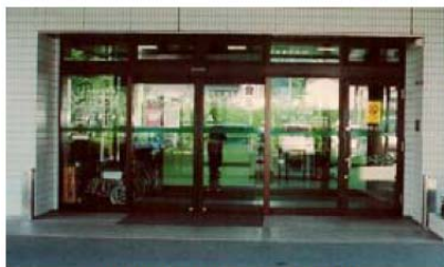
本館玄関への止水板設置状況(設置前)

その後、平成16年以降に、移動できないレントゲン等の医療機器の浸水対策として止水板や防水扉を設置しました。