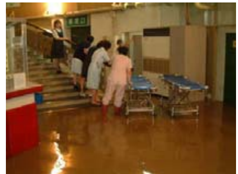
公立豊岡病院の浸水状況(平成16年10月)

また、平成22年10月の奄美豪雨災害では、鹿児島県奄美市内のグループホームが浸水し、施設の職員2名が懸命な救出活動を行ったものの、入居者9名のうち2名が死亡しました。