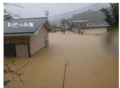
グループホーム わたつみ苑の浸水状況 (平成22年10月奄美豪雨)