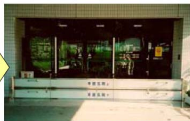
本館玄関への止水板設置状況(設置後)