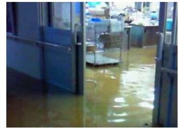
特別養護老人ホーム 幸福園の浸水状況

（例1） 山口県美祢市にある特別養護老人ホームでは、あらかじめ複数の責任者や避難場所（2階）を定めており、平成22年7月の水害では、早朝5時半に現場にかけつけた第3責任者が指揮をとり、1階の浸水が始まる40分前に、寝たきりの多い入所者の避難を完了させました。