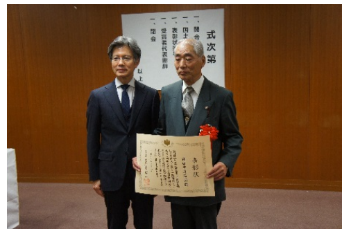
表彰式後、受賞者と事務次官