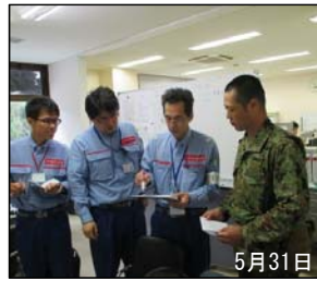
一時入島に向けた自衛隊との事前調整