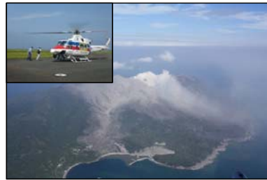
炎対ヘリによる降灰等の状況調査