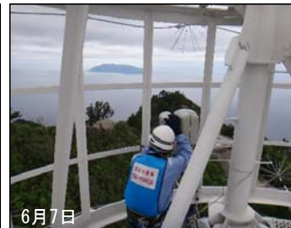
屋久島中継所に監視カメラを設置