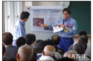
住民の方々にこれまでの調査結果を説明