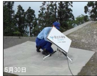
小型画像伝送装置 (Ku-sat) の設置