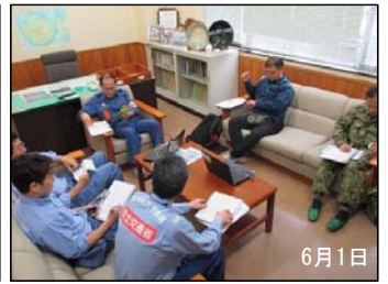
一時入島の状況を関係機関で監視