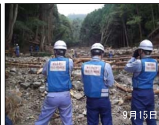
土石流箇所の被災状況調査 (栃木県日光市)