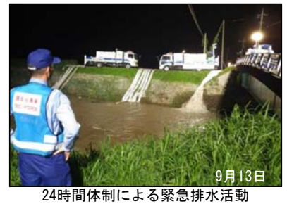
24時間体制による緊急排水活動