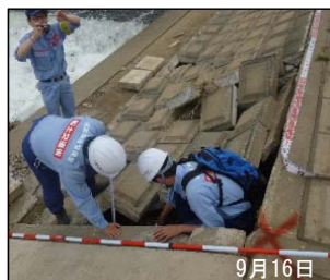
河川施設の被災状況調査