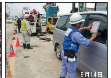
道路啓開による放置車両撤去