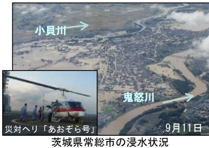
茨城県常総市の浸水状況