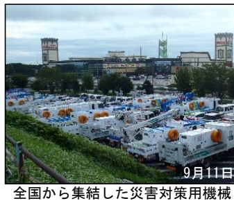
全国から集結した災害対策用機械