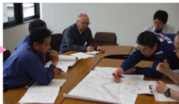
首長に調査結果を報告