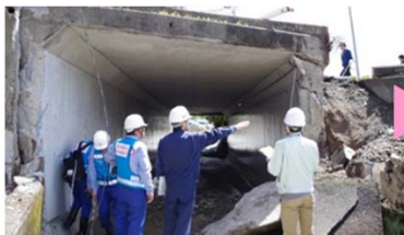
道路施設の被害状況調査