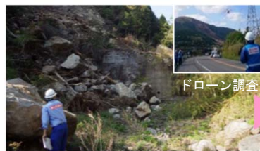
土石流危険渓流の点検