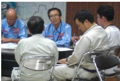
被災状況・要請内容等の把握 (小浜土木事務所)