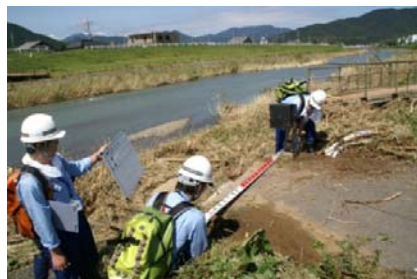
早期復旧に向けた状況把握 (舞鶴市境谷橋)