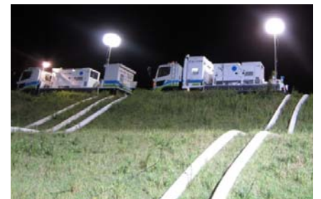
排水ポンプ車による緊急排水 (福知山市荒河地先)