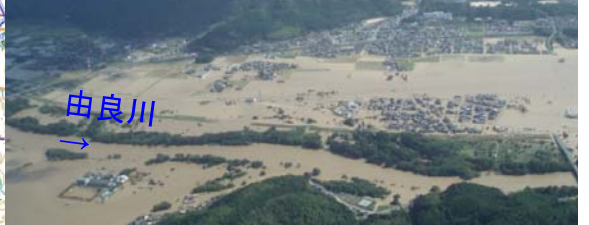
ヘリコプターによる浸水状況の把握