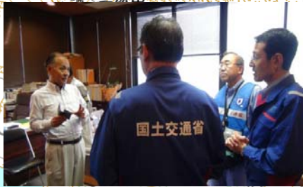
国土交通省 国交省リゼンと大島町職員との現場対応に係る調整