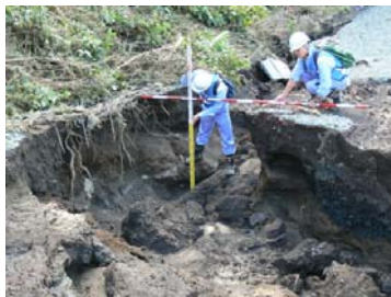
早期復旧に向けた被災箇所の把握