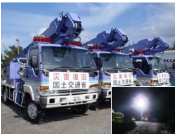
救助・救援、復旧支援のための照明車派遣