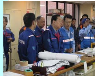
太田国土交通大臣によるTEC-FORCEへの指示