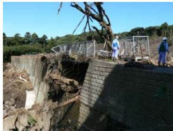
砂防ダム機能状況の確認