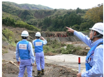
土石流流下状況の把握