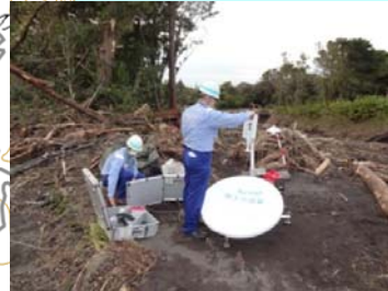
被災現場での監視カメラの設置