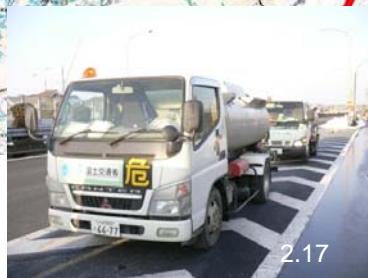
関東地整TEC-FORCEによる 救援物資(燃料)輸送支援 (山梨県富士吉田市)