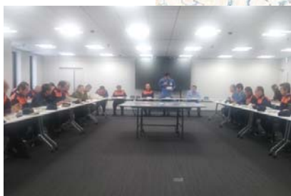
政府現地対策本部(山梨県庁)開催状況