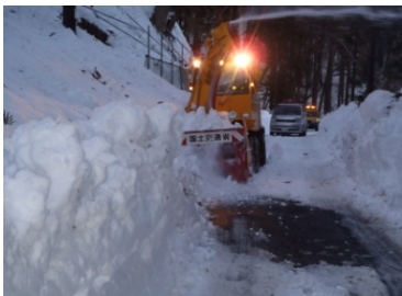
県道河口湖精進線除雪状況 (富士河口湖町)