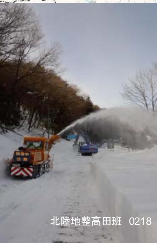
【山梨県支援】 孤立解消へ向けた除雪状況