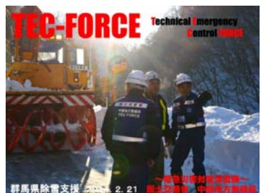
【群馬県支援】 効率的な除雪へ向けた状況把握(中部地方整備局TEC-FORCE)