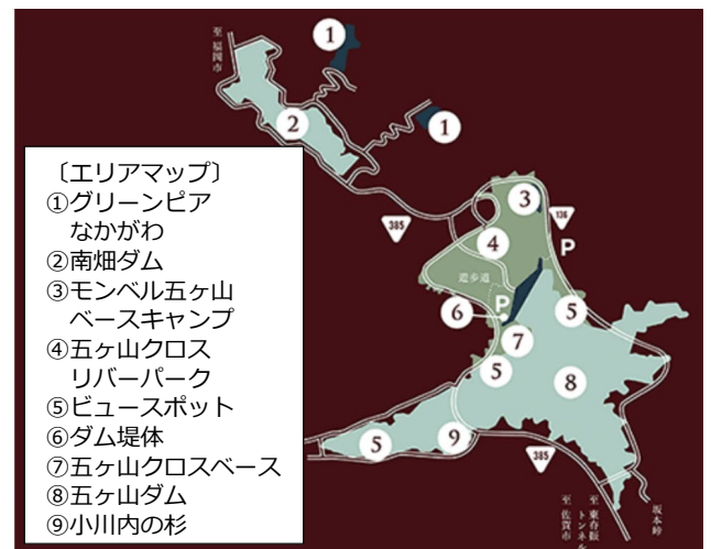
五ヶ山クロス エリアマップ