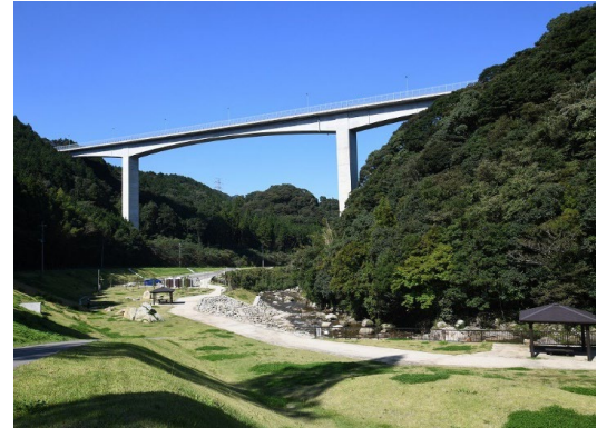
親水護岸を県が、公園を市が整備した「五ヶ山クロスリバーパーク」