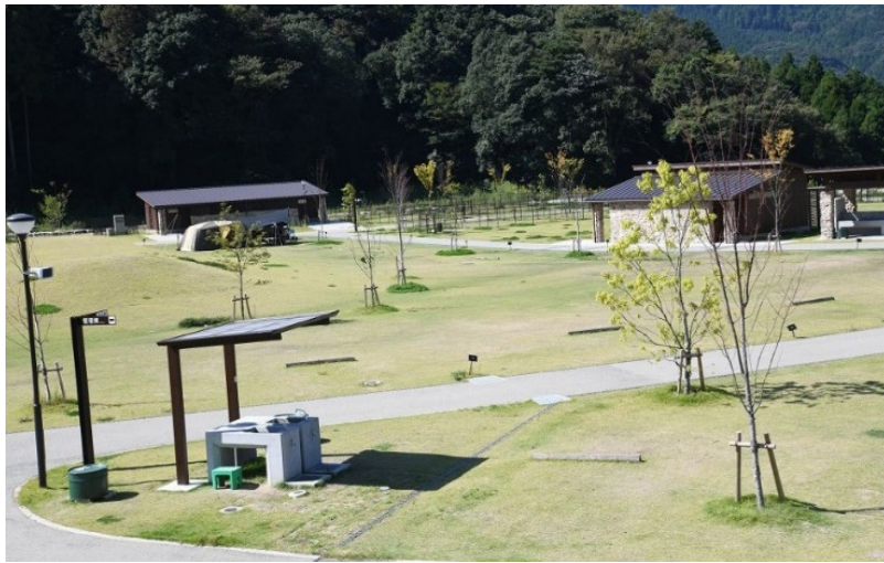
「モンベル五ヶ山ベースキャンプ」のキャンプサイト