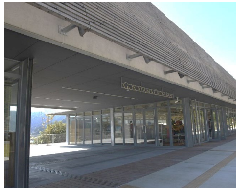
モンベルショップとレストランが入居する「五ヶ山クロスベース」