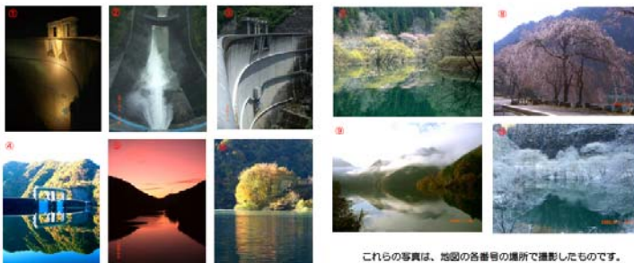
これらの写真は、地図の各番号の場所で撮影したものです。