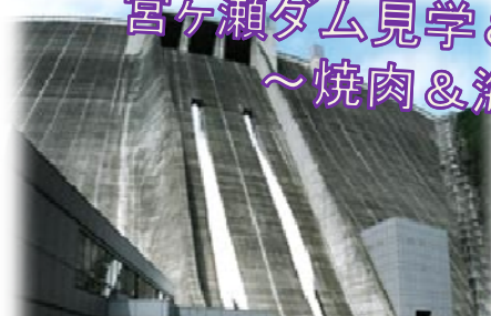
大迫力の観光放流