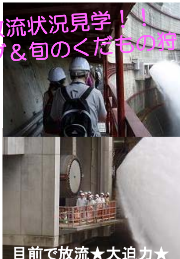
目前で放流★大迫力★