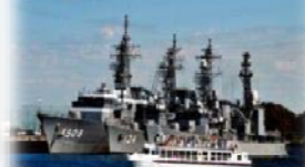
艦船を間近で見学