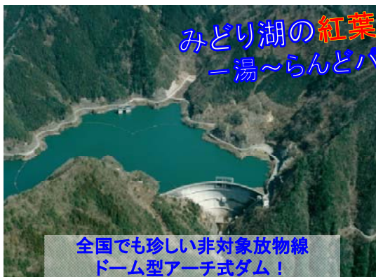
全国でも珍しい非対象放物線ドーム型アーチ式ダム！