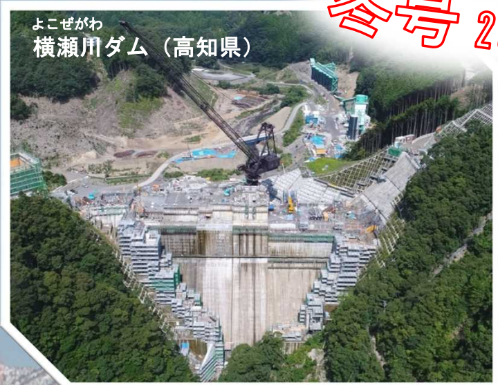
よこぜがわ 横瀬川ダム (高知県)