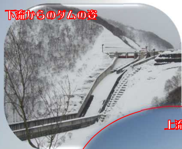
下流からのダムの姿