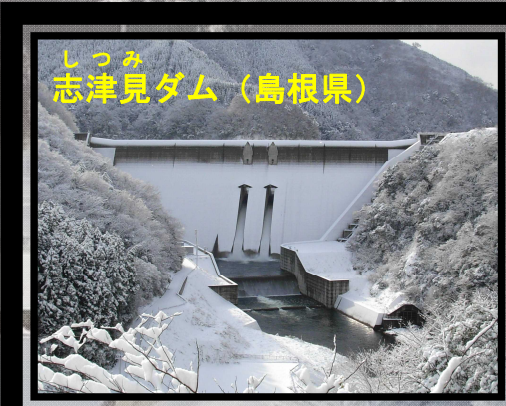
しつみ 志津見ダム (島根県)

冬の建設ダム特集・上記ツアーの他、以下の建設中のダムでも、現場見学会を実施中♪ ※冬期休工等のため春以降開始予定です。 ○ダム本体を建設中のダム 築川ダム※(岩手県)、最上小国川ダム※(山形県)、鶉川ダム※(新潟県)、安威川ダム(大阪府)、平瀬ダム※(山口県)、浜田ダム(島根県)、横瀬川ダム(高知県)、和食ダム(高知県)、栴川ダム(香川県)、小石原川ダム(福岡県) ○ダム湖の水を放流する施設を建設中のダム 千五沢ダム(福島県)、天ヶ瀬ダム(京都府)、長安口ダム(徳島県)、鹿野川ダム(愛媛県) ○ダム湖に貯まった土砂を排出するための施設を建設中のダム 美和ダム(長野県) ○ダムに水を貯めながら安全性を確認しているダム 奥胎内ダム※(新潟県) ○ダム本体の建設を行うために、一時的に河川の流れを迂回させる水路を建設中のダム 吉野瀬川ダム※(福井県)、足羽川ダム(福井県)、新丸山ダム(岐阜県) ○ダムを支える土台となる岩盤を露出させるために柔らかい岩などを掘削中のダム 成瀬ダム※(秋田県)、内ヶ谷ダム※(岐阜県)、川上ダム(三重県) ○各イベントについては企画会社に問い合わせをお願いします/ダムツーリズムに関する情報は下記WEBをご参照ください http://www.mlit.go.jp/river/dam/dam_tourism.html (工事の見学が可能などダム等の情報も掲載しています) ○パンフレットに関するお問い合わせは下記のとおりです 国土交通省 水管理・国土保全局 治水課 〒100-8918 東京都千代田区霞が関 2-1-3 中央合同庁舎3号館1階 TEL:03-5253-8453