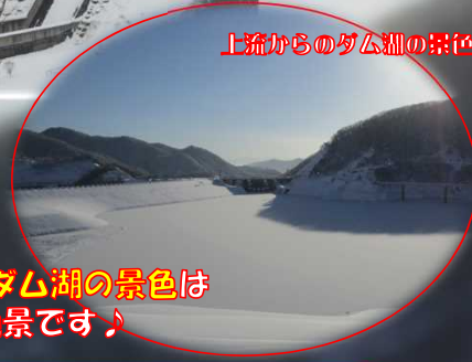
上流からのダム湖の景色