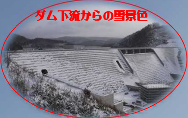
ダム下流からの雪景色