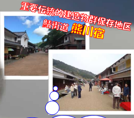
重要伝統的建造物群保存地区 鯖街道 熊川宿

河内川ダムから車で約5分♪宿場町の面影を残す町並みの中で、特産品や食べ歩き、「宿場館」でこの土地の歴史を学ぶのもいかが?