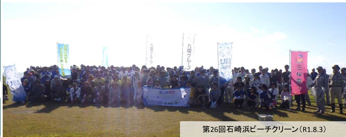
第26回石崎浜ビーチクリーン(R1.8.3)