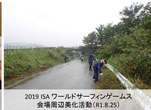
2019 ISA ワールドサーフィンゲームス 会場周辺美化活動(R1.8.25)