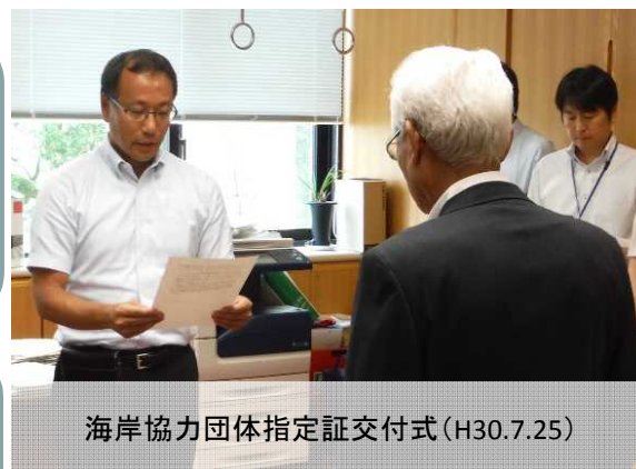
海岸協力団体指定証交付式(H30.7.25)

今後も海岸愛護・美化に関する活動を通じて、 社会に貢献できる団体となることを目指します。