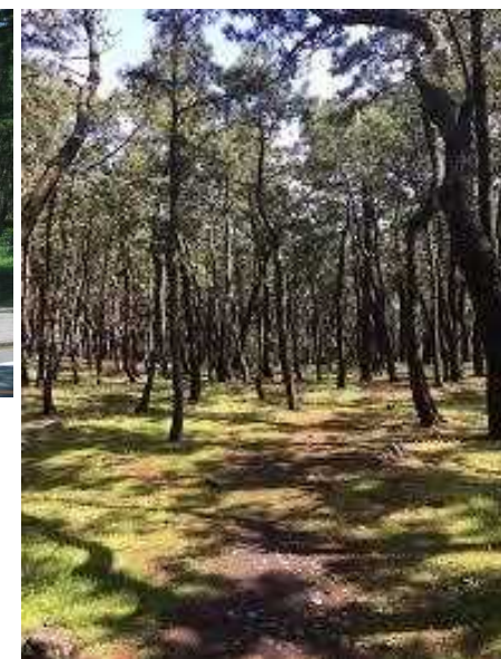
千本浜海岸、千本浜公園