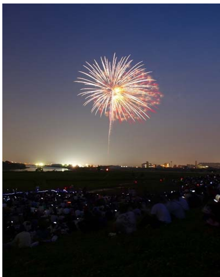
庄内川河川敷の打上花火