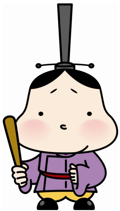
大津市観光キャラクター 「おおつ光くん」