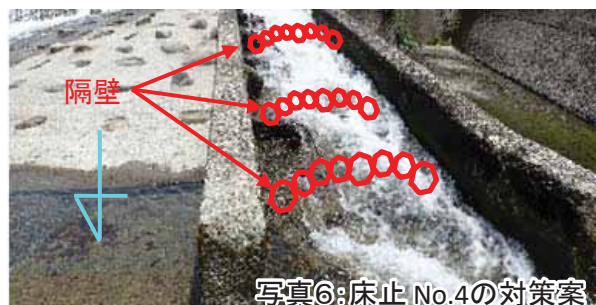
写真6: 床止 No.4の対策案