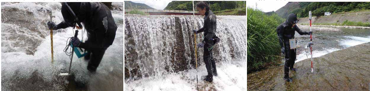
写真2:水深・流速(左)、水面落差(中)、周辺地形(右)の各計測状況