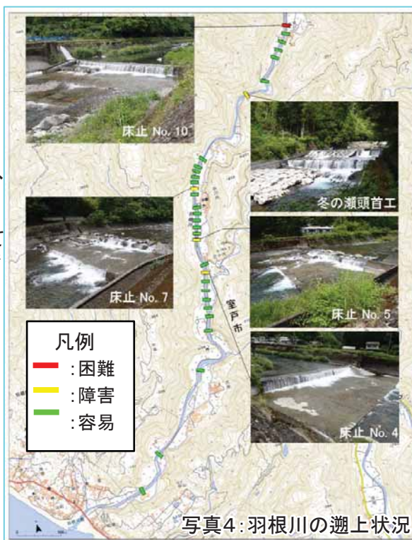
写真4: 羽根川の遡上状況