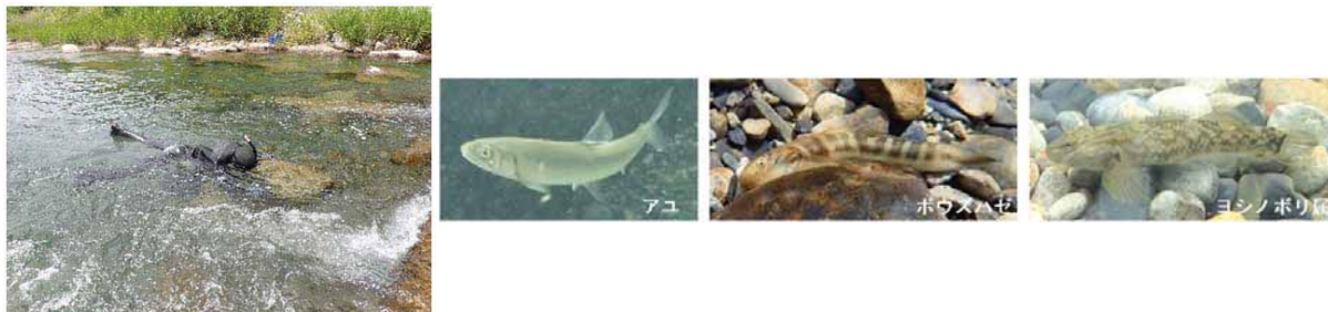
写真3: 魚類調査の様子および調査対象の回遊性魚類

○対象構造物の上下流において、潜水目視観察を行って生息密度(尾/㎡)を求め、魚類の分布状況を把握した。調査対象は、相対的に強い遡上性を示すアユ等の回遊性魚類(写真3)とした。調査は鮎漁が解禁されるまでに終わらせることとした。※調査日:令和2年5月22日