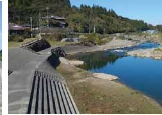
○景観配慮(コンクリートの明度低減)