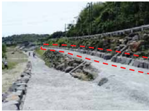
○現地発生材による石積みベンチ