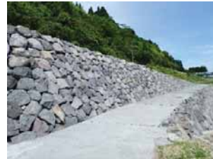
○自然石石積み護岸