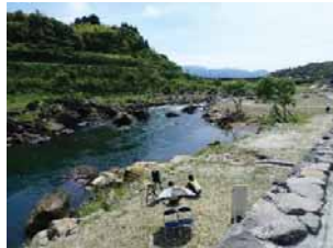
○水際は改変しない