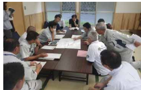
轟地区かわまちづくり推進協議会