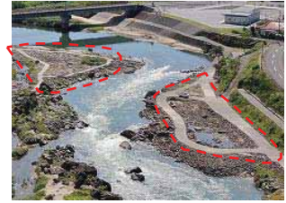
○散策路(管理用通路)