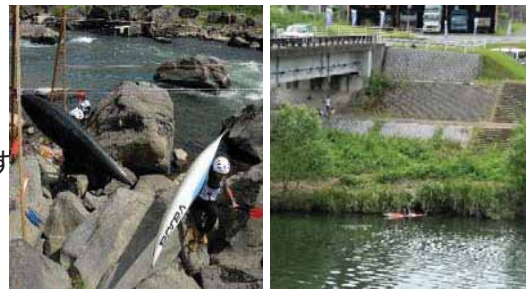
安全なカヌー利用・水辺へのアクセスが困難