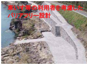
○カーン発着場(バリアフリー型)