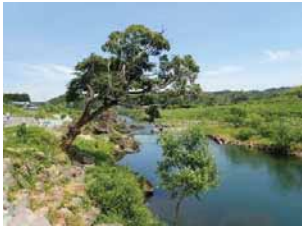
○巨木・巨石は極力残す