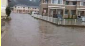
平成25年7月27日豪雨時の小藪川

近年多発する集中豪雨により小流域の都市内の河川の浸水被害が増加 小藪川上流域の都市部では、近年浸水被害が発生し、平成25年7月豪雨では、床上45戸、床下62戸の浸水被害が発生