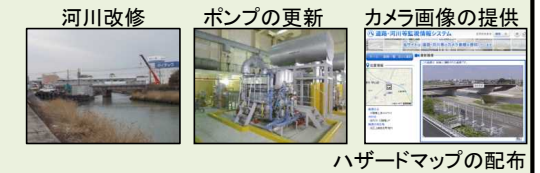
ハザードマップの配布

○危険情報周知、水防活動 ・Webを利用した雨量、水位情報、道路、河川のカメラ画像、ポンプ運転状況の提供 ・ハザードマップ(内水・外水)を全戸に配布 ・各区で市民と行政が一体となった「総合水防訓練」等の実施