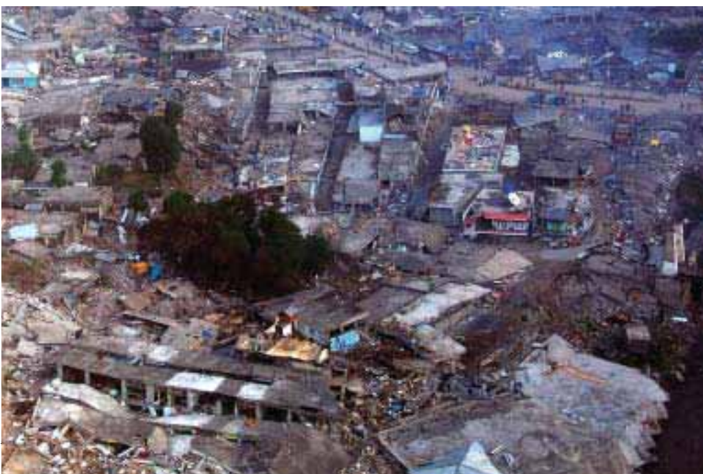
壊滅的な被害を受けたバラコート市内

イスラム信者が全国民の約97%を占めるパキスタンでは6日にイスラム教の宗教行事ラマダン（断食月）が始まったばかりで、早朝礼拝を済ませて家で寝込んでいたため逃げ遅れ、人的被害が拡大。死者はパキスタンだけで7万3000人を超え、被災者は300万人に達した。また、家屋の倒壊で数百万人が自宅を失った。さらに粗末なテントでの集団生活、上下水道などインフラの破壊、食料や飲料水不足による低栄養状態が相まって、被災地域の衛生状態は極端に悪化した。