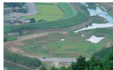
河川の氾濫源的湿地の再生 松浦川（佐賀県）