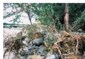
堤内への土砂流入の防止状況