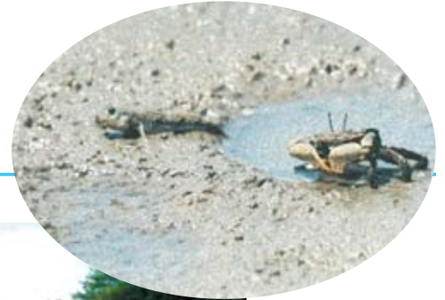
河口部の干潟再生

自然再生事業は、治水や利水を目的とする事業の中でミティゲーションとして川の環境保全を行うのではなく、河川環境の保全を目的とし、流域の視点から「川のシステム」を再自然化する初めての河川事業です。また、この事業は極力人間の手を入れず、自然の復元力を活かし行う事業です。