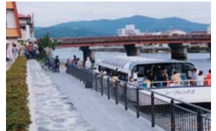
■菊池川水系上内田川 (熊本県)