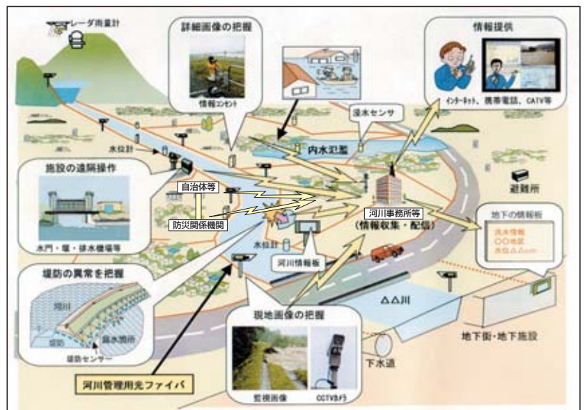
河川管理におけるICT活用イメージ