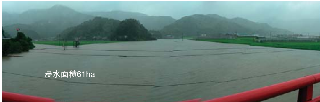
吉井箇所浸水状況 (H19.7.15 5時)

那賀川の吉井地区では、平成19年7月の台風4号において、堤防整備及び排水機場の整備が完成したことにより、 住家及び県道の浸水被害を回避 することができました。