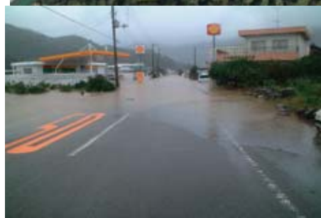
県道浸水 (H16.10 台風23号)