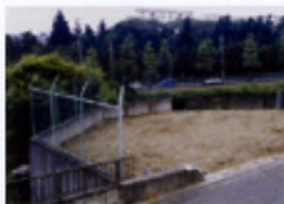
埋め立て後の状況