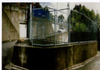
従前の防災調整池 (約500m 3 規模)