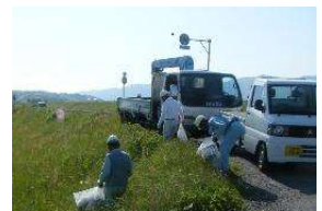
異物等の除去状況(例)