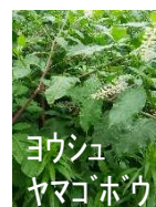
ヨウシュ ヤマゴボウ