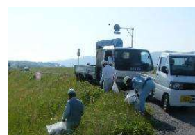
異物等の除去状況(例)