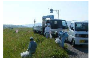
異物等の除去状況(例)