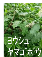
ヨウシュ ヤマゴボウ