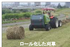
ロール化した刈草