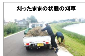
刈ったままの状態の刈草

※除草により発生した刈草を刈ったままの状態でもありますが、地域の需要等に応じてロール化することも検討します。