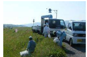
異物等の除去状況(例)