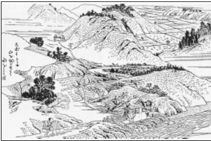
図中文章 (現代語要約) スポイトで山を越えて送水する図