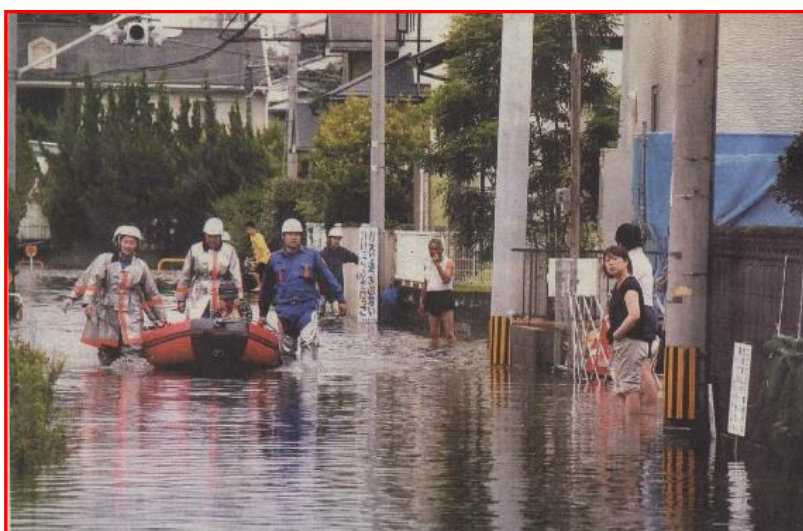
ボート救助(久留米市消防団)H24.8.16