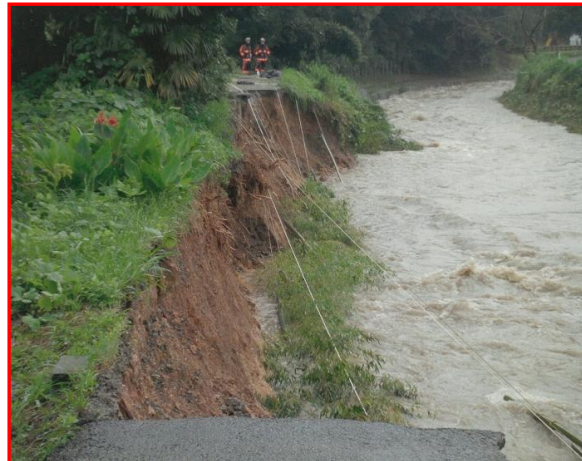
木流し工による洗掘防止(久留米市消防団)