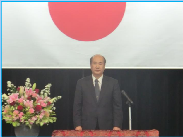
国土交通大臣挨拶(事務次官代読)