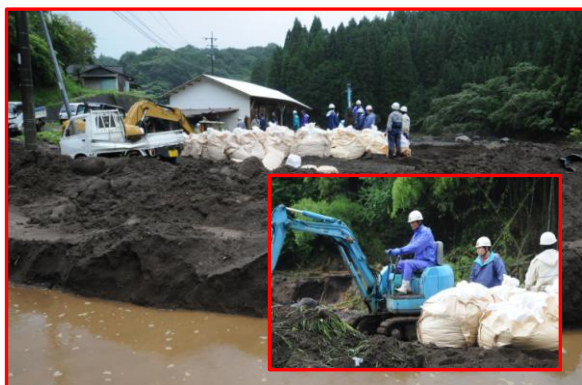
大型土のう積み作業(竹田市消防団)