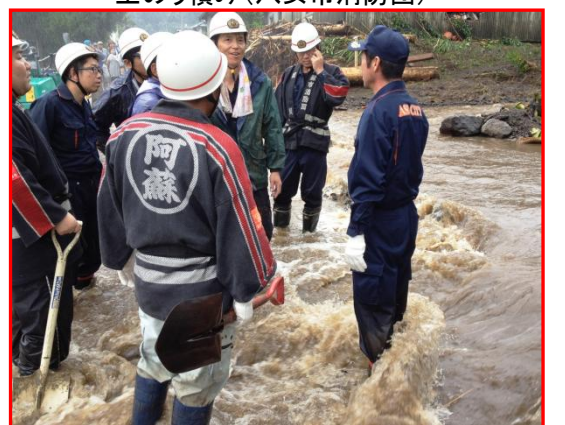
濁流の中、活動打ち合わせ(阿蘇市消防団)