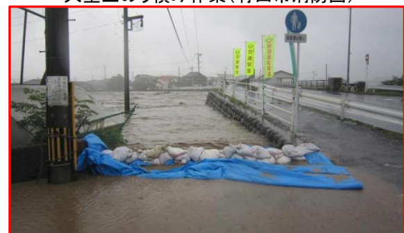
土のう積み(八女市消防団)