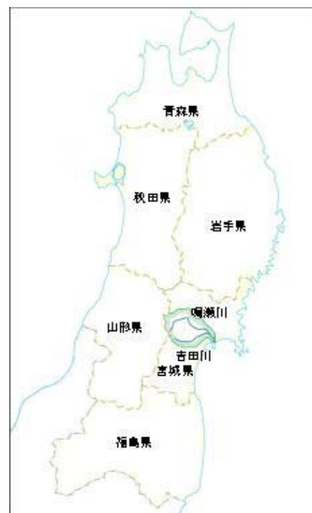
(参考図) 鳴瀬川水系図