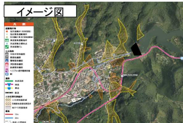
ダム下流区間ハザードマップ作成イメージ