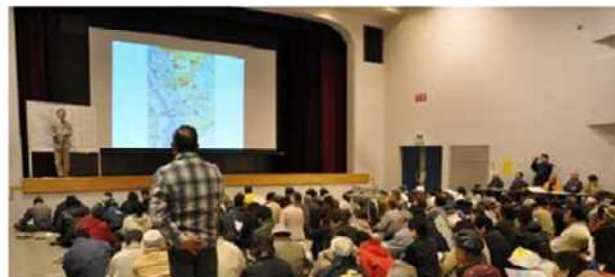
地域住民への周知(説明)イメージ