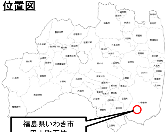
福島県いわき市 田人町石住