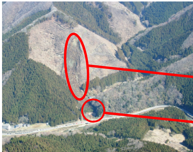
東北地整へり「みちのく号」からの状況写真