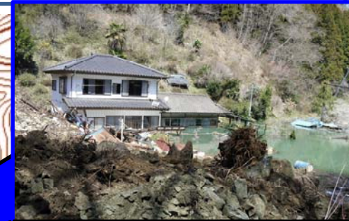
河道閉塞(天然ダム)による被災