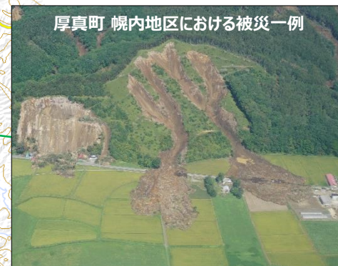
厚真町 幌内地区における被災一例