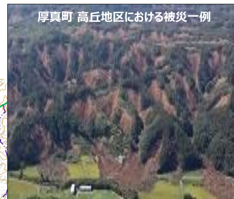
厚真町 高丘地区における被災一例