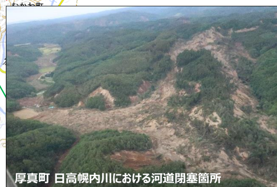
厚真町 日高幌内川における河道閉塞箇所