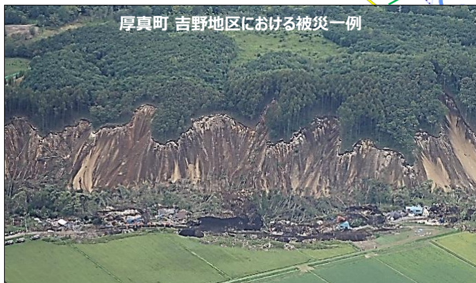
厚真町 吉野地区における被災一例