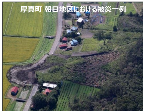
厚真町 朝日地区における被災一例