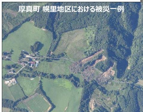
厚真町 幌里地区における被災一例