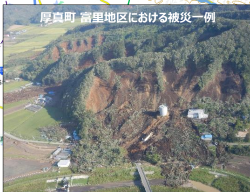
厚真町 富里地区における被災一例