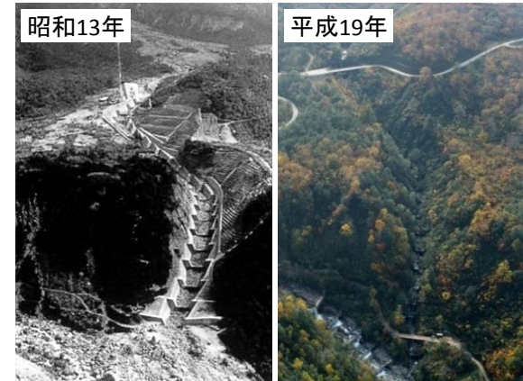
泥谷堰堤(昭和13年竣工)