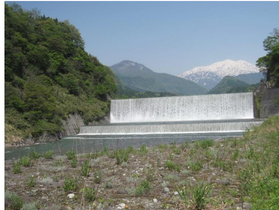
本宮堰堤(昭和11年竣工)