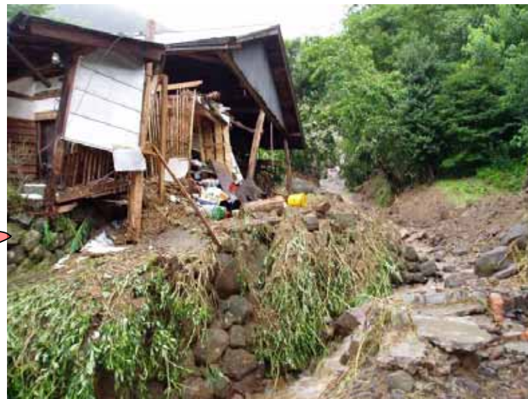
降雨状況 観測所名：大分県鯛生(国土交通省)