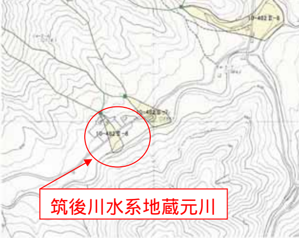
筑後川水系地蔵元川