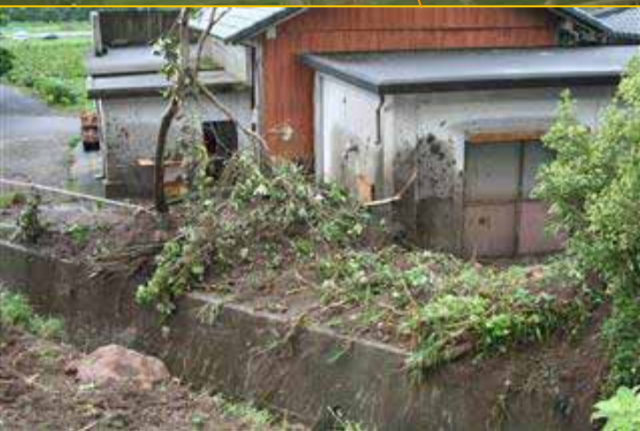
きもつきぐん みなみおおすみちよう こおり かわたはら 鹿児島県 肝属郡 南大隅町 郡 川田原