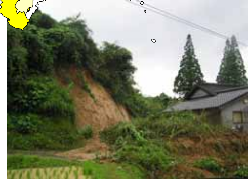
うきし おがわまち きたかいとう 熊本県 宇城市 小川町 北海東 (負傷者 1名)