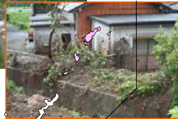
きもつきぐん みなみおおすみちよう 鹿児島県 肝属郡 南大隅町 こおり かわたはら 郡 川田原