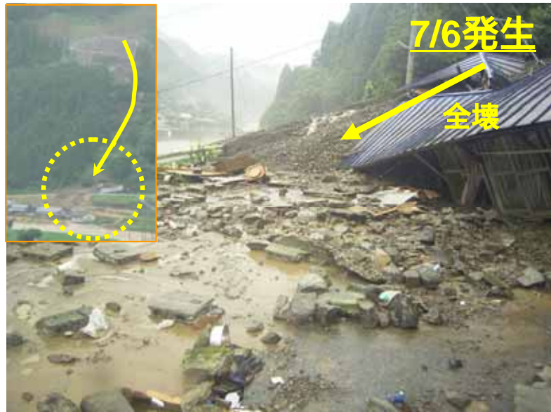
かみましきぐん やまとまち こうまちく 熊本県 上益城郡 山都町 甲馬 (家屋全壊1戸 避難により人的被害なし)