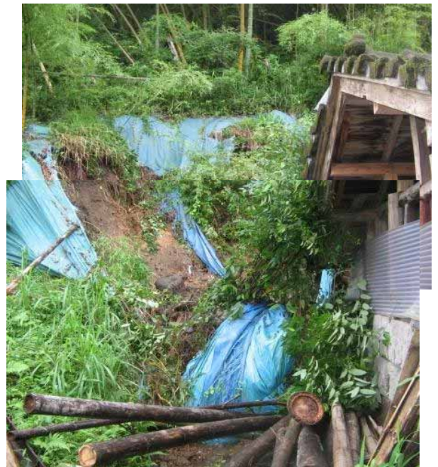
あいらぐん かじきちよう へがわ つるほら 鹿児島県 始良郡加治木町 辺川 鶴原