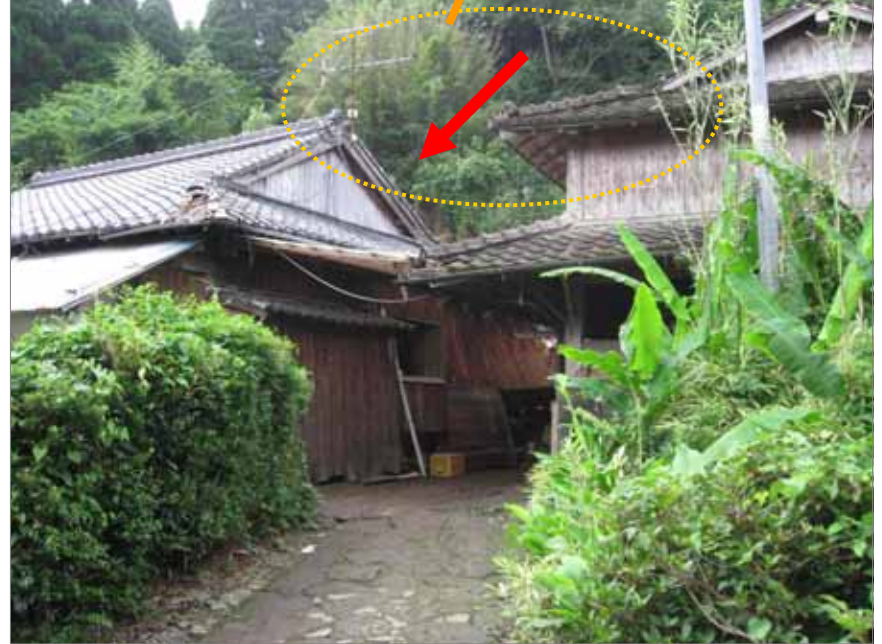
長崎県 いさはやし おがわ めおとぎ 諫早市 小川町 夫婦木