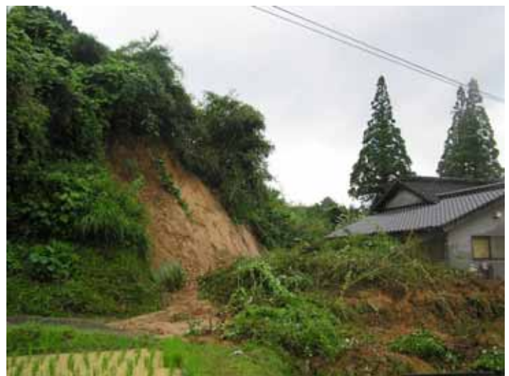
熊本県 宇城市 小川町 北海東 (負傷者 1名)