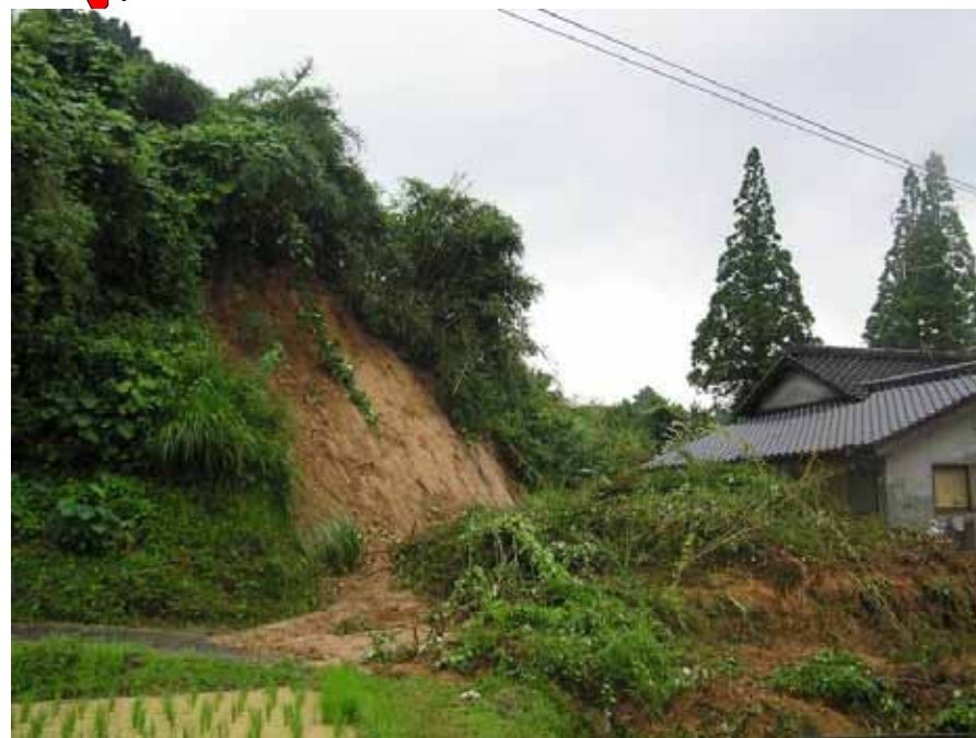
うきし おがわまち きたかいとう 熊本県 宇城市 小川町 北海東 (負傷者 1名)