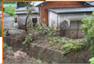
きもつきぐん みなみおおすみちょう 鹿児島県 肝属郡 南大隅町 こおり かわたはら 郡 川田原