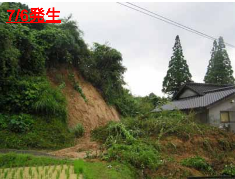
うきし おがわまち きたかいとう ひらばら 熊本県 宇城市 小川町 北海東 平原 (負傷者 1名)