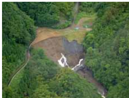
やつしろし いずみまち ほうのき 熊本県 八代市 泉町 朴の木