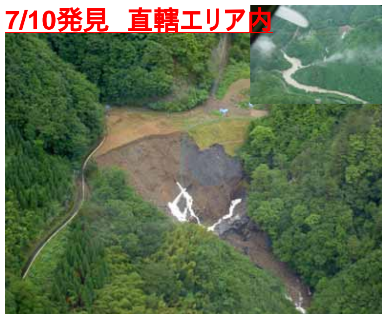
やつしろし いずみまち ほうのき 熊本県 八代市 泉町 朴の木