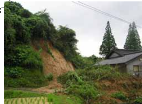
うきし おがわまち きたかいとう 熊本県 宇城市 小川町 北海東 (負傷者 1名)