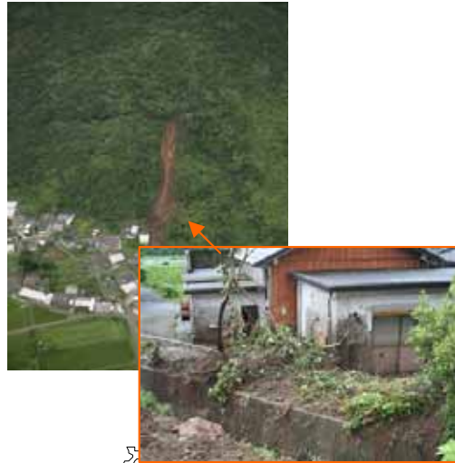
きつぎん みなみおすみちよう 鹿児島県 肝属郡 南大隅町 こおり かわたばら 郡 川田原