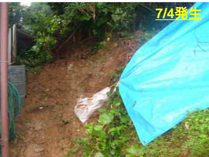
たまなぐん なごみまち ひがしよしじ ながうら 熊本県 玉名郡 和水町 東吉地 永浦