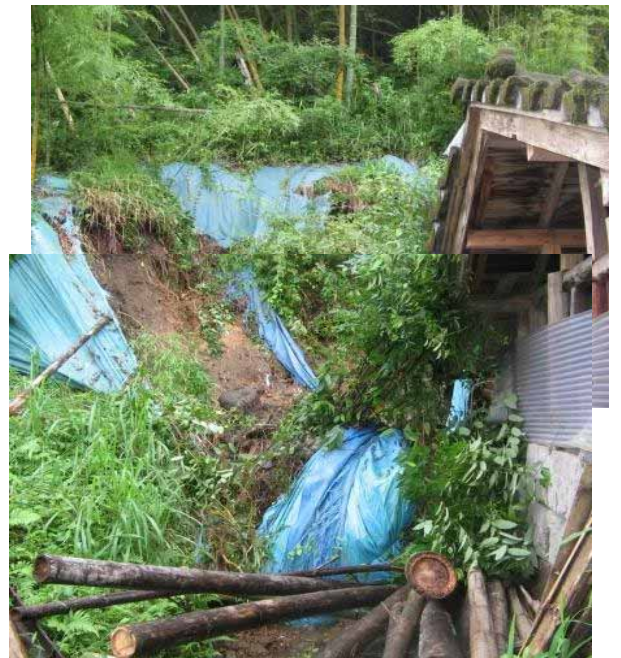
あいらぐん かじきちょう へがわ つるほら 鹿児島県 始良郡加治木町 辺川 鶴原