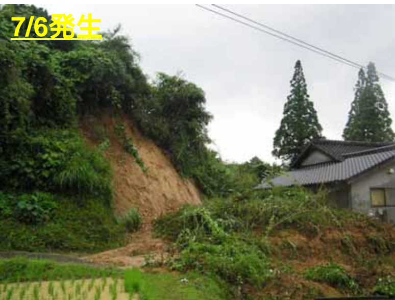
うきし おがわまち きたかいとう ひらばら 熊本県 宇城市 小川町 北海東 平原 (負傷者 1名)