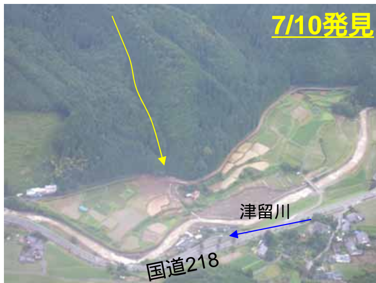
しもましきぐん みさとまち さかいいし 熊本県 下益城郡 美里町 境石