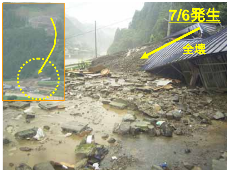
かみましきぐん やまとまち こうまちく 熊本県 上益城郡 山都町 甲馬 (家屋全壊1戸 避難により人的被害なし)