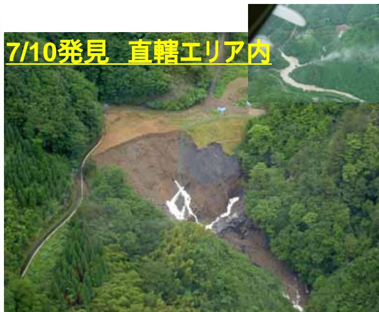
やつしろし いずみまち ほうのき 熊本県 八代市 泉町 朴の木