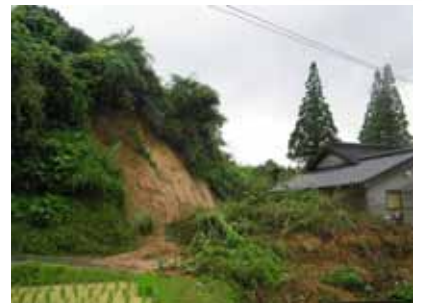
うきし おがわまち きたかいとう