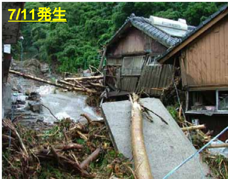
きもつきぐん みなみおおすみちょう さたごおり はましり 鹿児島県 肝属郡 南大隅町 佐多郡 浜尻