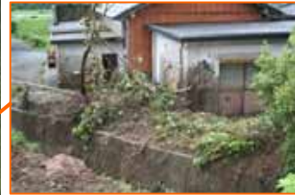
きもつきぐん みなみおおすみちよう