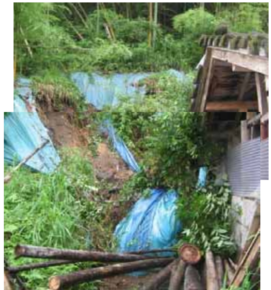
あいらぐん かじきちょう へがわ つるばら 鹿児島県 始良郡加治木町 辺川 鶴原