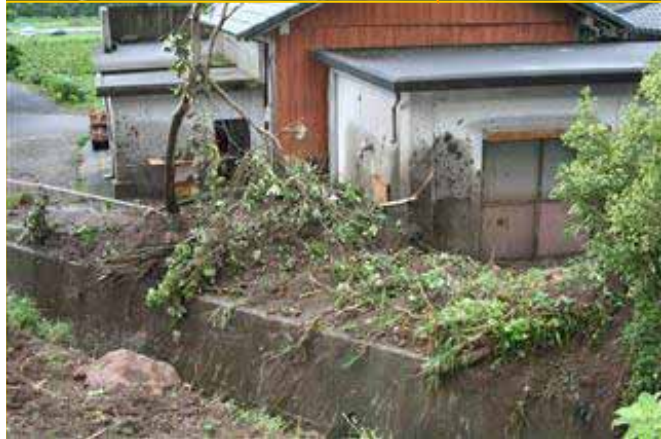
きもつきぐん みなみおおすみちょう こおり かわたはら 鹿児島県 肝属郡 南大隅町 郡 川田原