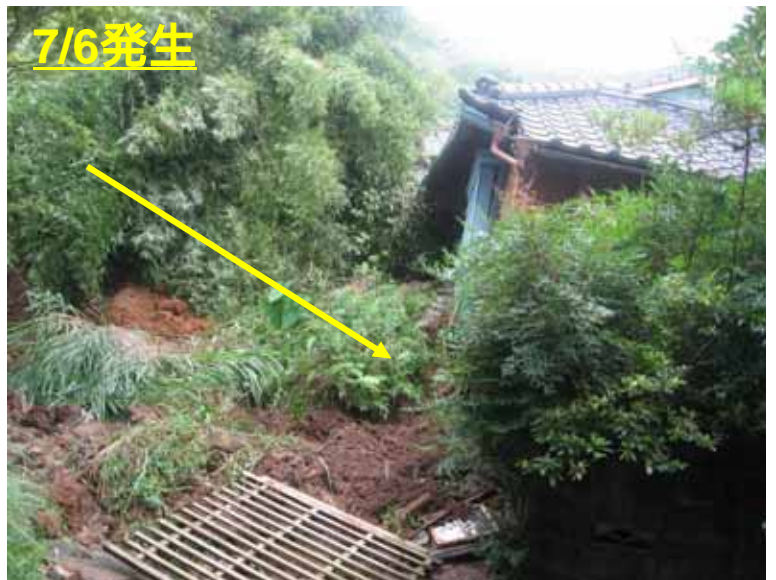
まくらざきし さくらやまにしまち ゆあな 鹿児島県 枕崎市 桜山西町 湯穴