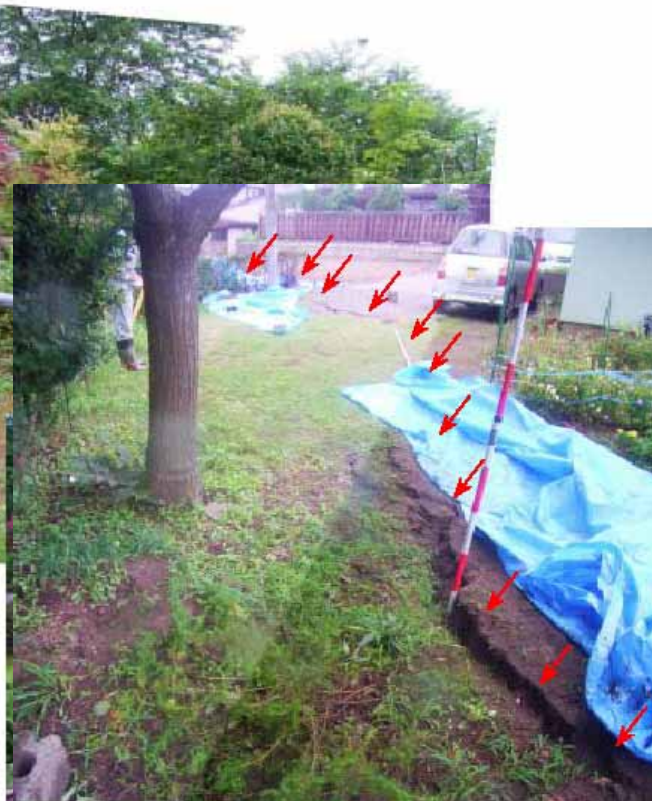
じょうえつし かきざきく 新潟県 上越市 柿崎区