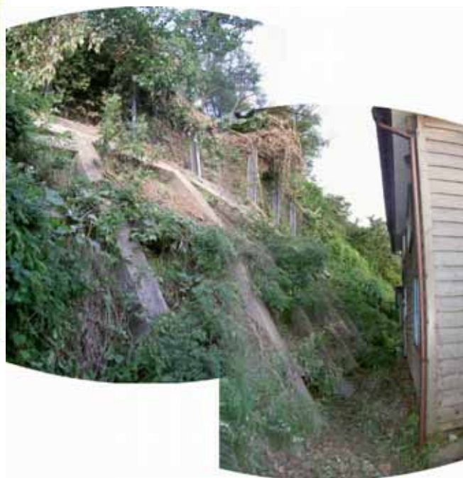
かしわざきし あげわ 新潟県 柏崎市 上輪