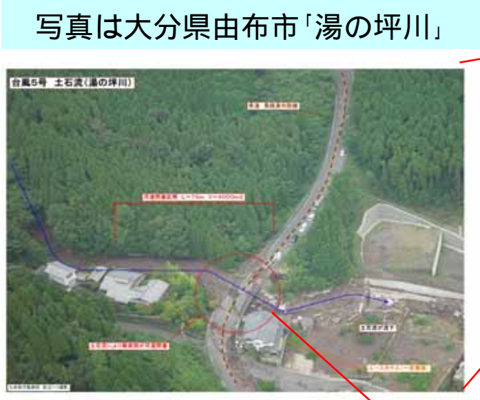
写真は 大分県由布市「湯の坪川」