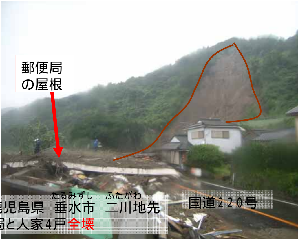
7月15日発生 鹿児島県 垂水市 二川地先 国道220号 土石流により郵便局と人家4戸全壊