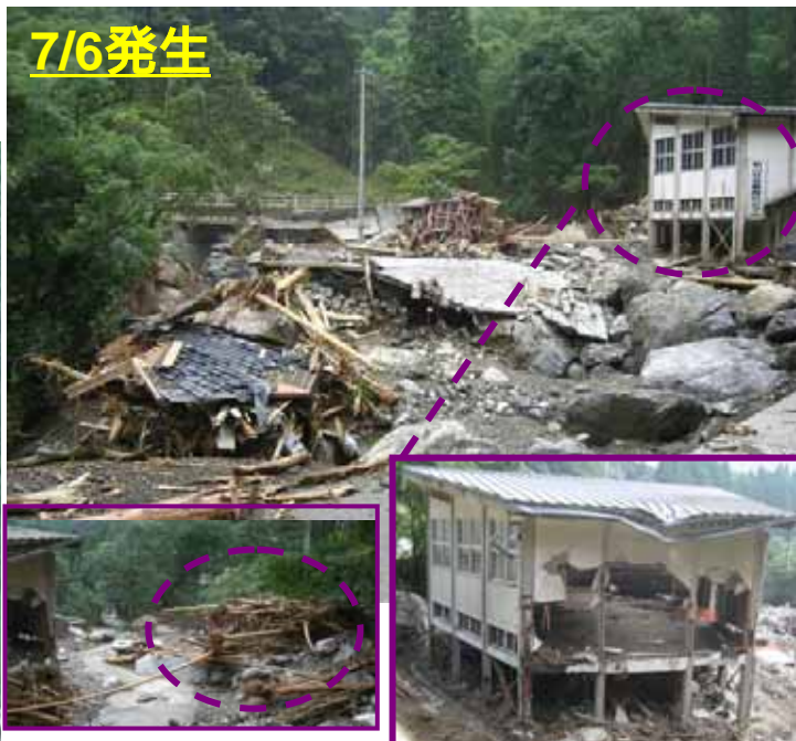
きもつきぐん みなみおおすみちよう こおり かわたはら 全壊した「柏川集会所」 全壊した「社会教育センター」 鹿児島県 肝属郡 南大隅町 郡 川田原 しもましきぐん みさとまち くねくさ 熊本県下益城郡美里町楠根草